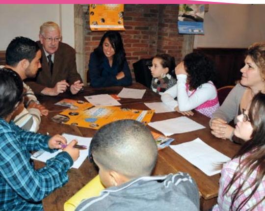
Lors de la Semaine européenne de la démocratie locale, les enfants ont rencontré les élus locaux, notamment le Bourgmestre, et trouvé des idées de projets à mettre en œuvre

Cette année, les actions proposées tourneront autour de « la semaine du mot magique », la publication d'une BD afin de sensibiliser les parents à la politesse et filmer des « bonnes » et « moins bonnes » pratiques « politesse ». Les enfants choisiront dans les prochaines semaines les sujets qui déboucheront sur plusieurs actions concrètes à réaliser au sein de leur établissement. Histoire de se faire la main et en attendant le jour J de « leur » grand conseil.