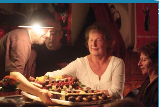
30 ans pour le CAFE DE LA RUE