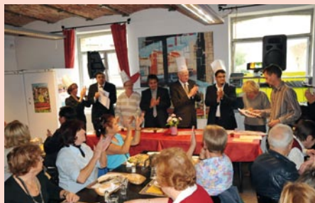
Proclamation des résultats