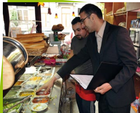
Les inspecteurs de la Cellule de Coordination socio-économique

La CCSE se compose de 5 personnes. Ici, pas d'uniformes, les agents effectuent leurs