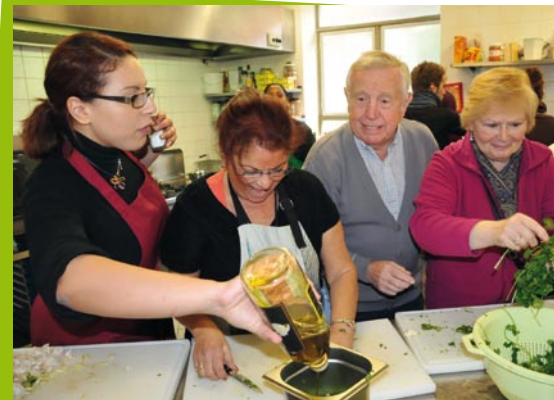
Le CPAS organise de nombreuses formations et animations (ici, journée « Bien dans son assiette » au restaurant social « Les Uns et les Autres » le 26 octobre dernier)

L'autre dispositif consiste à faire émerger le projet de parcours professionnel de la personne avec le « facilitateur de projet » pour déterminer la meilleure orientation possible. L'usager et l'accompagnateur décident ensemble s'il faut orienter vers la cellule Etudes / Formations ou vers la cellule Emploi. Dans celle-ci, les personnes peuvent bénéficier de toute une infrastruc-