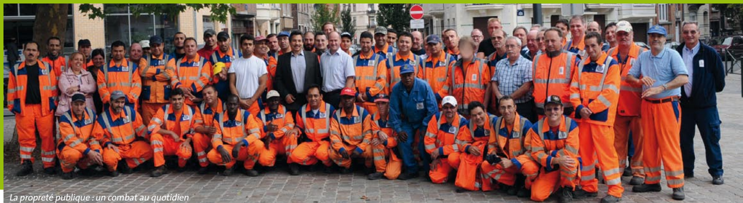
La propreté publique : un combat au quotidien