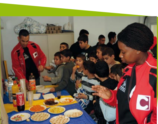
Les animateurs sportifs ont un nouvel uniforme depuis 2009