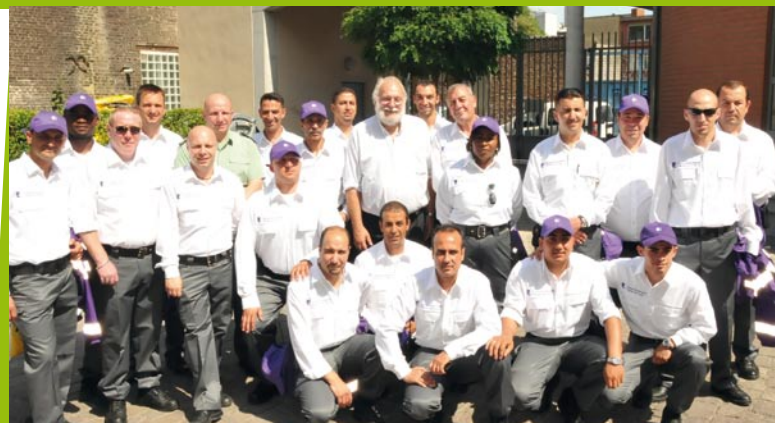
Les Gardiens de la Paix ont un nouvel uniforme depuis l'été 2010 (mauve)

Il n'y a qu'à se promener dans les rues ou au sein de la maison communale pour constater que nombreux sont les uniformes en tous genres. Mauve ici, rouge là-bas, bleu ailleurs, ... Les couleurs sont partout mais qui fait quoi? Si certains sont sur le terrain, d'autres sont dans les bureaux mais tous remplissent une même mission: ils sont là à votre service. Survol des rôles et missions de chacun.