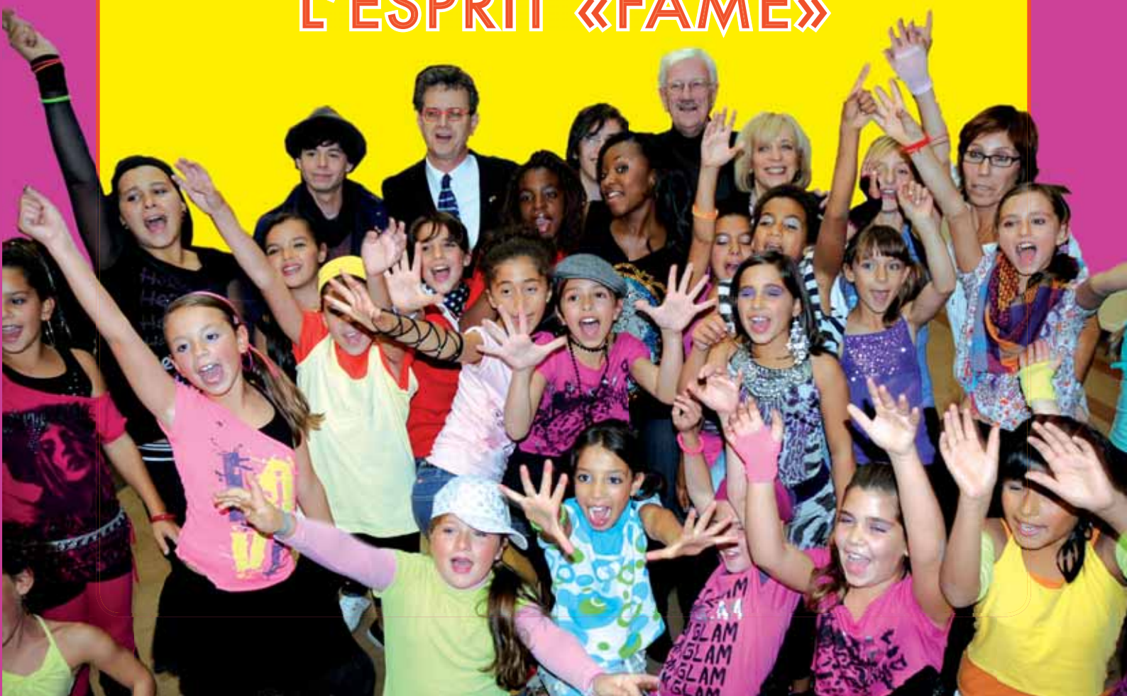
Toots Thielemans, citoyen d'honneur