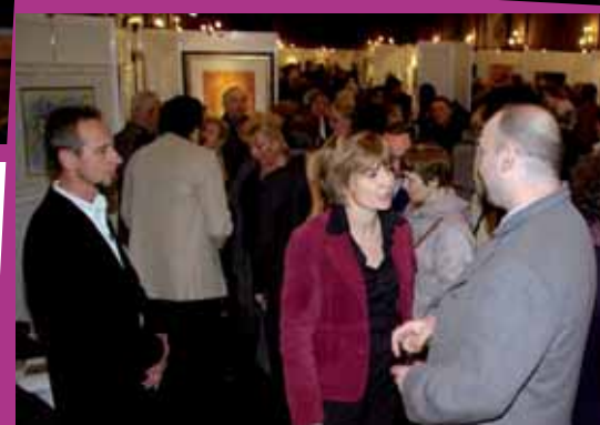
Festivités du Marché de Noël au Karreveld les 11, 12 et 13 décembre 2009