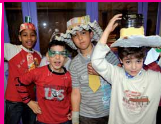
Les enfants ont sensibilisé leurs copains et les adultes à la nécessité de trier les déchets

Pour mieux comprendre et pratiquer le tri des déchets, on a aussi rencontré un agent de Bruxelles-Propreté qui nous a appris com-