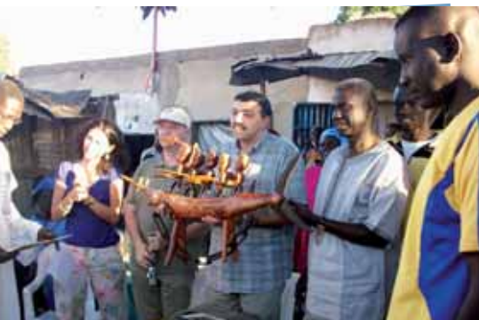
L'Echevin Ahmed El Khannouss en visite dans la commune de Mbour au Sénégal

Hall des sports Heyvaert : quai de l'Industrie, 31 à 1080 Bruxelles. Tél.: 02 526 93 00 Ouvert 6 jours par semaine, de 8 h 30 à 22 h 00