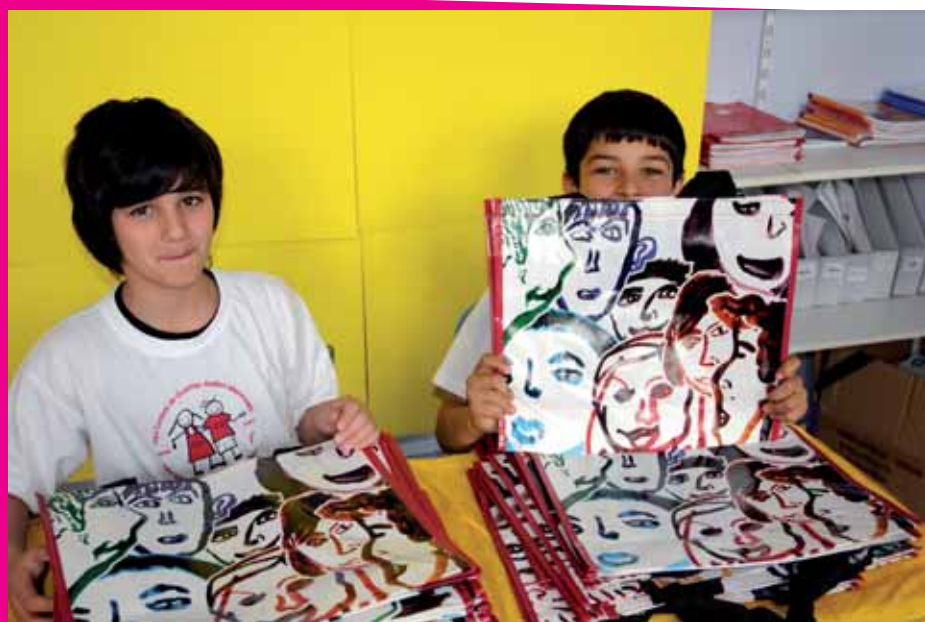
Les écoliers ont créé un sac réutilisable, fabriqué à partir de bouteilles en plastique

Pour terminer en beauté, en juin 2009, nos apprentis citoyens ont fait une grande fête pour rendre la planète plus belle. En collaboration avec l'école des Tamaris, le projet « Donnons des couleurs à notre quartier » leur a permis de réaliser un défilé de mode dans l'école dont les vêtements avaient la particularité d'être créés à partir de ...déchets. Enfin, un grand cortège dans le quartier a conclu leurs actions, au son de slogans comme « Rendre la planète plus belle, c'est le défi de notre école ! ». Vu l'enthousiasme et le succès, l'expérience se répétera dès septembre 2009, à l'école 5 (Place de la Duchesse de Brabant), dans le cadre du nouveau Contrat de quartier « Ecluse - Saint-Lazare ».