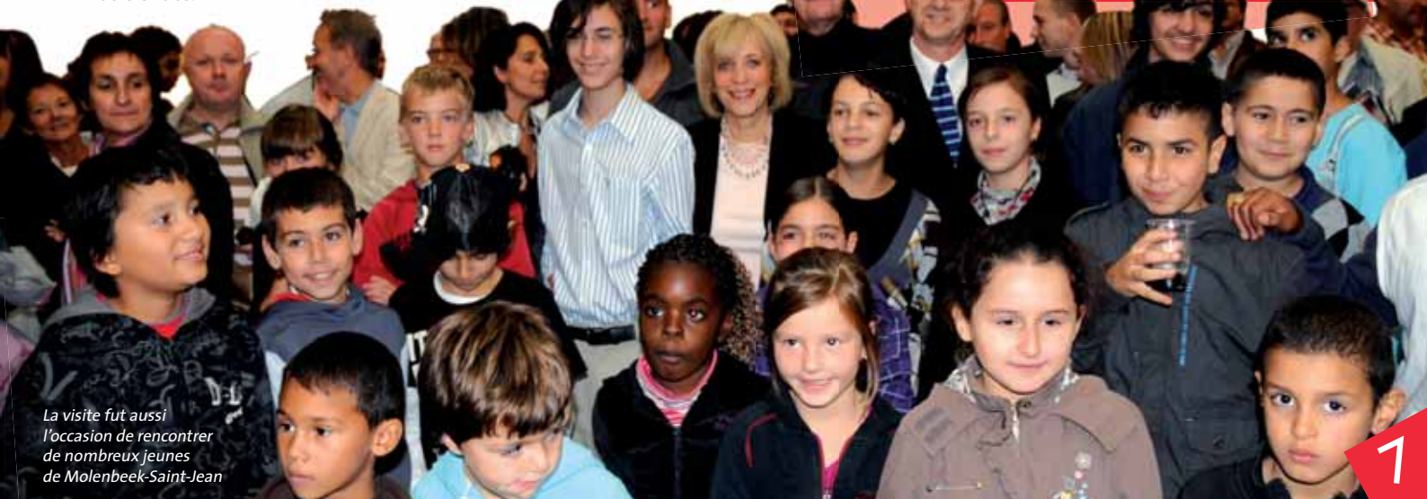
La visite fut aussi l'occasion de rencontrer de nombreux jeunes de Molenbeek-Saint-Jean