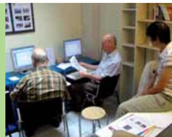
L'asbl Solidarité Savoir organise de nombreuses activités à caractère social

maîtrisent en échange d'un autre , explique le responsable. Par semaine, nous avons 20 échanges qui ont lieu au sein de « Solidarité Savoir », de 9 h à 17 h 30. Ce qui fonctionne le mieux, ce sont les échanges en langues, en cuisine, en couture et en informatique. Le RES, c'est aussi un espace, une structure que nous offrons aux gens pour leur permettre de se rencontrer et de rompre l'isolement social.