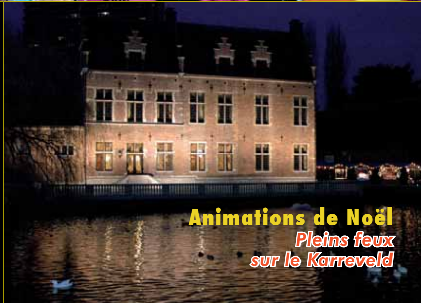
Animations de Noël Pleins feux sur le Karreveld