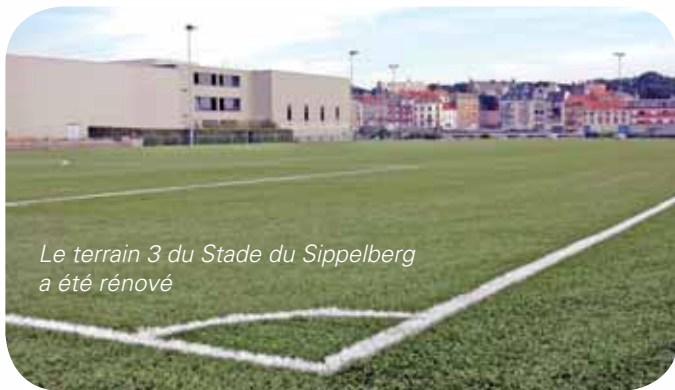
Le terrain 3 du Stade du Sippelberg a été rénové

L'école de Formation des Jeunes de Molenbeek, c'est 38 équipes avec environ 600 joueurs de 5 à 19 ans. Elle se compose d'une école de football (Poupons-minimes - 1 ère année), d'un centre de préformation pour les 13-15 ans, d'un centre de formation pour les 16-19 ans, du football de transition (provinciaux) et des pôles élites/espoirs qui forment le vivier de l'équipe 1 ère . Chaque entité agit de manière autonome, en étant gérée par un conseiller technique et un secrétariat spécifique. Un travail qui porte ses fruits puisque le centre molenbeekois de formation au football a été classé 3 ème au niveau national, preuve de la qualité de son programme d'entraînement.