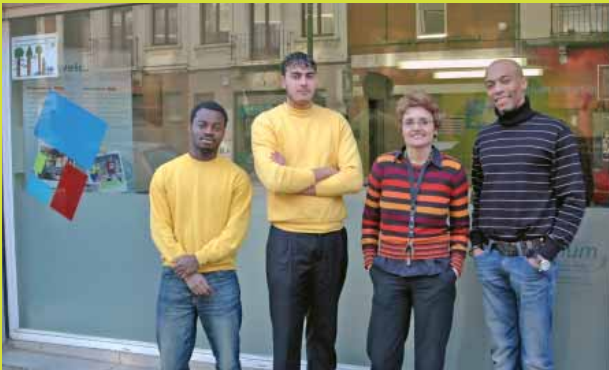
L'équipe de l'Atrium Karreveld

Info : Chaussée de Gand, 441. Tél.: 02 414 05 93 karreveld@atrium.irisnet.be