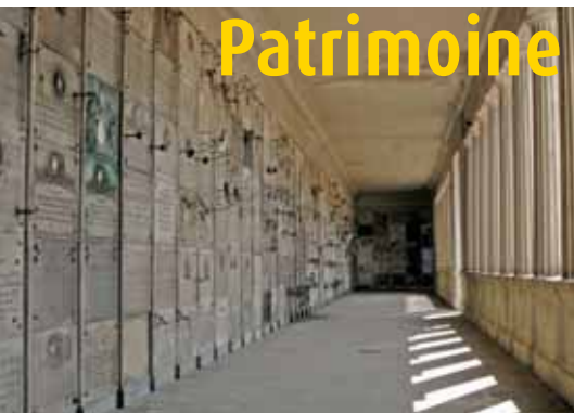
Une architecture remarquable à découvrir Een merkwaardige architectuur te ontdekken

Le cimetière de Molenbeek est l'un des premiers de Bruxelles, inauguré en 1864. Ses galeries funéraires furent conçues plus tard, en 1880 et construites en diverses phases jusqu'en 1907. Situées à un endroit bien visible, dans le prolongement de l'allée d'honneur, elles sont particulièrement remarquables. Leurs proportions et la sobriété du style architectural néo-classique confèrent à l'ensemble un caractère majestueux.