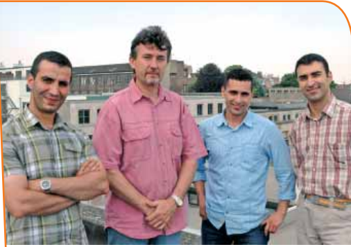
La cellule de coordination socio-économique