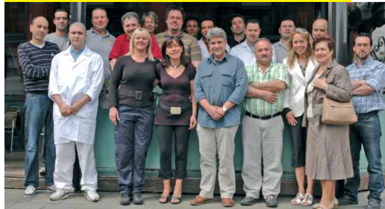
Les commerçants de l'asbl "CENTER KARREVELD"

Citons le Coin Perdu (à hauteur de la rue du Korenbeek), le Comité de Kermesse de la Queue de Vache, l'Historic Molenbeek Center committee (établi rue de Ribaucourt) ou, encore, le Molenbeek Center Shopping (chaussée de Gand) qui assurent, par la promotion de braderies ou autres festivités, le développement de nos commerces et contribuent aussi à animer les quartiers avoisinants.