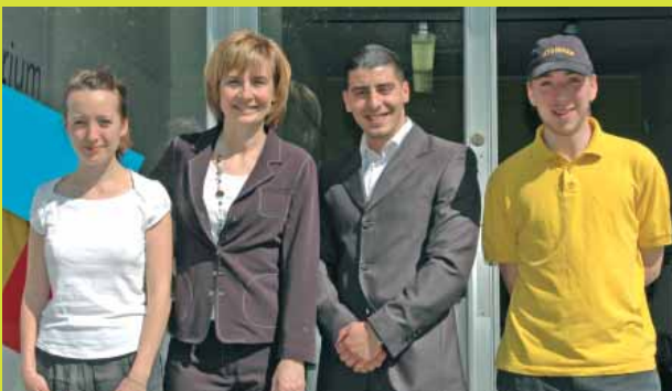
L'équipe de l'Atrium Chaussée de Ninove avec l'Echevine Française SCHEPMANS

Info : Chaussée de Ninove, 487. Tél.: 02 613 67 36 melfikri@atrium.irisnet.be