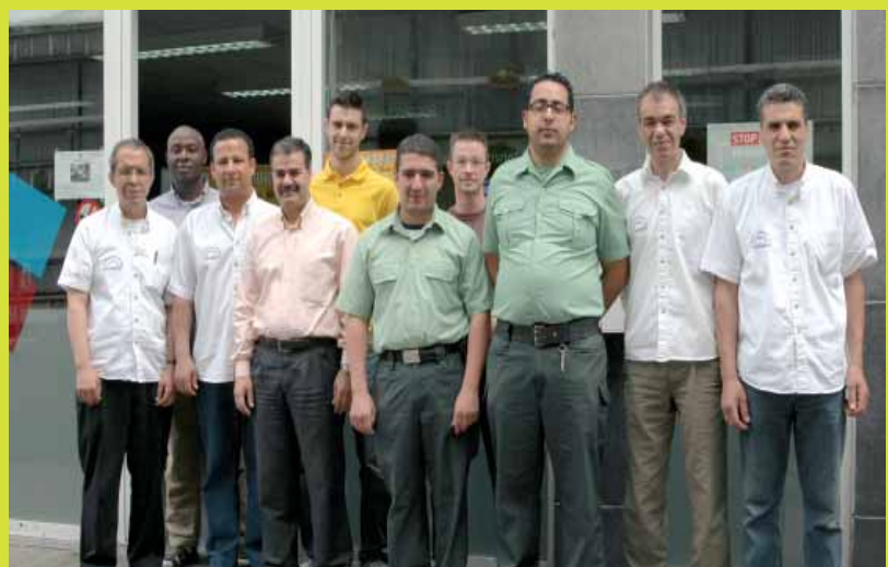
L' Atrium « Molenbeek Center Shopping »

Info : Rue Fernand Brunfaut, 4B. Tél.: 02 410 77 02 - aazdad@atrium.irisnet.be