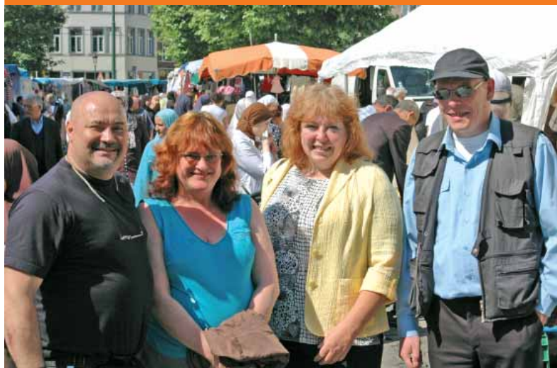
De dienst Middenstand en Economie

Middenstand: Graaf van Vlaanderenstraat 20 – 1080 Brussel Tel : 02 412 36 33 – Tel/Fax: 02 412 37 78 E-mail: classesmoyennes.1080@molenbeek.irisnet.be