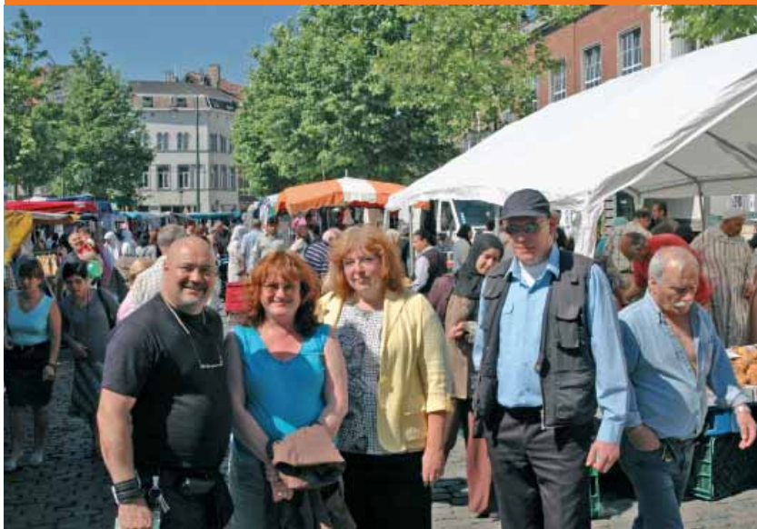
Le service des Classes moyennes et Economie

Classes moyennes : Rue du Comte de Flandre, 20 Tél.: 02 412 36 33 - 02 412 37 78 classesmoyennes.1080@molenbeek.irisnet.be