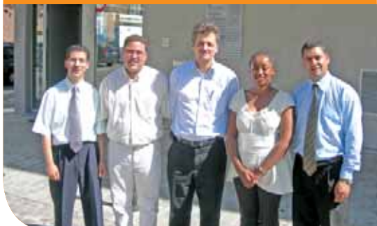
Het Plaatselijk economieloket

Loket voor plaatselijke economie: Meelfabrieksplein 10 - 1080 Brussel Tel.: 02 410 01 13 - info@gelm.be Site : www.c-entreprises.be