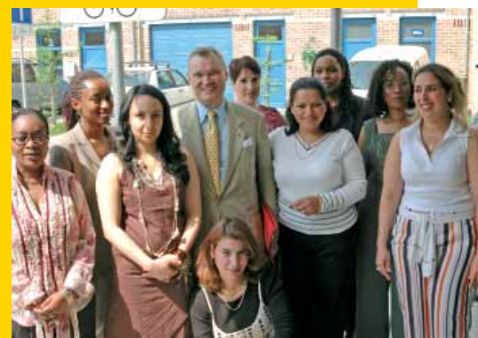
Le Centre d'Entreprises

CEM 1 : Rue des Ateliers, 7/9 CEM 2 : Place de la Minoterie, 10 Couveuse : rue Le Lorrain, 110 Tél.: 02 412 10 00