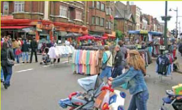
Rommelmarkt in de Karreveldwijk: 14 juni 2008