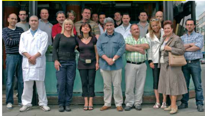
De handelaars van vzw "CENTER KARREVELD"

De Verloren Hoek (ter hoogte van de Korenbeekstraat), het Kermiscomité van de Koeieschiët, het Historic Molenbeek Center Committee (gevestigd in de Ribaucourtstraat) en het Molenbeek Center Shopping (Steenweg op Gent) zijn slechts enkele van deze antennes die de ontwikkeling van onze handelszaken garanderen en door de promotie van braderieën en andere festiviteiten bijdragen tot het levendiger maken van de naburige wijken.