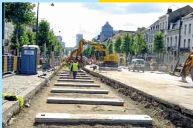
Importants travaux au boulevard Léopold II cet été Belangrijke werken aan de Leopold II-laan deze zomer

De Steenweg op Gent , die dagelijks door tal van voertuigen gebruikt wordt, vormt een belangrijke verkeersas voor de mobiliteit in Brussel. De steenweg lag er bijzonder slecht bij en de voetpaden en het wegdek moesten daarom grondig gerenoveerd worden. Om het verkeer niet danig in de knoop te brengen, werd de werf in 6 fasen ingedeeld, vanaf het kanaal tot aan het Zwarte Vijversplein. De eerste 5 fasen zijn voltooid.