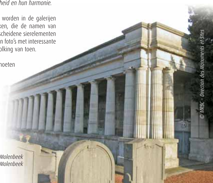
Les galeries funéraires du cimetière de Molenbeek De begrafenisgaleries van het kerkhof van Molenbeek

Kerkhof van Molenbeek : Steenweg op Gent 537 1080 Brussel