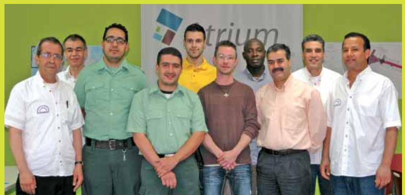
Atrium « Molenbeek Center Shopping »

Info: Fernand Brunfastraat 4B. Tel.: 02 410 77 02 - azdad@atrium.irisnet.be