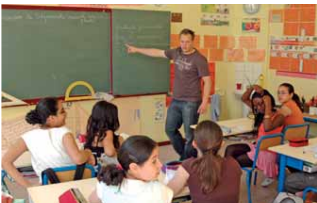
« La Rose des Vents » et « Windroos » échangent leurs professeurs de langues « La Rose des Vents » en « Windroos » wisselen hun taalleraars uit

Fin juin, une évaluation de ce premier trimestre « à l'essai » a permis d'ajuster au mieux le projet d'échange d'enseignants qui, dans le cadre de la circulaire ministérielle, devra se mettre en place durant l'année scolaire 2008-2009.