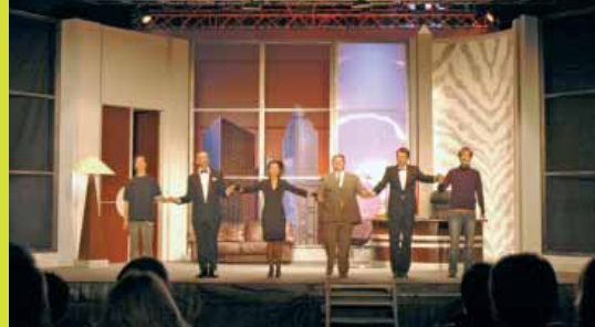
Festival de théâtre "Bruxellons" au Karreveld : 10 ans ! Theaterfestival "Bruxellons" in het Karreveldkasteel : 10 jaar !

Au Château du Karreveld : avenue Jean de la Hoese, 3 à 1080 Bruxelles.