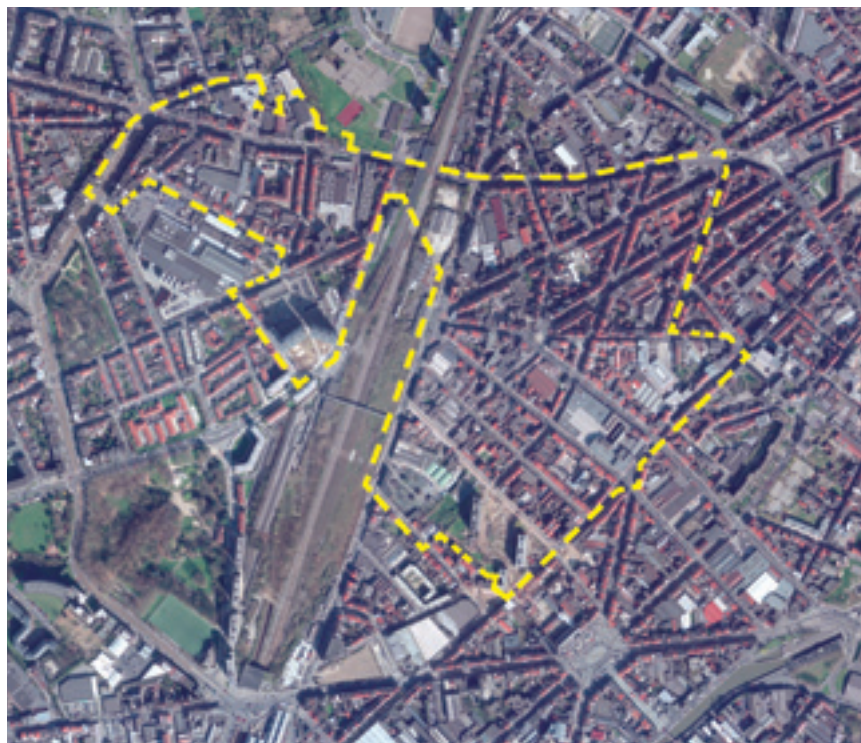
De perimeter van wijkcontract "Westoever": links, de Zone West (wijken nabij het Karreveld). Rechts: de Zone Oost (Vandenpeereboomstraat en omgeving). In het centrum: de site van het Weststation.

Het Plan voorziet deze zone hoofdzakelijk te bestemmen tot woningen, handelszaken, kantoren, productieactiviteiten, gemeenschapsuitrustingen of uitrustingen van een overheidsdienst en tot groene ruimtes, verklaart de Stedenbouwkundige. Op de 90.000 m 2 van de site stel-