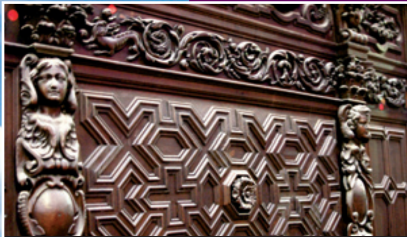
Boiseries des stalles de l'église d'origine en cours de restauration Houtwerk van de oorspronkelijke koorstoelen van de kerk, die gerenoveerd worden