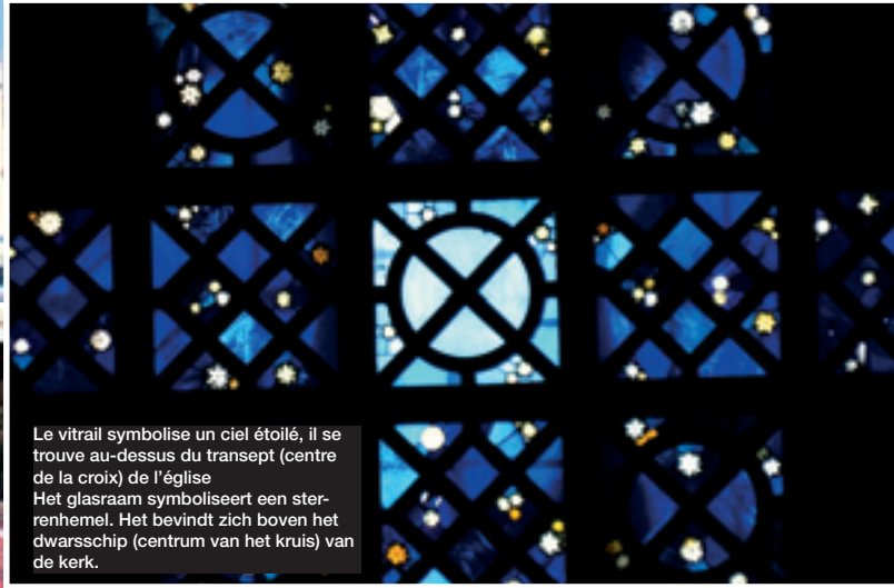
Le vitrail symbolise un ciel étoilé, il se trouve au-dessus du transept (centre de la croix) de l'église Het glasraam symboliseert een sterrenhemel. Het bevindt zich boven het dwarschip (centrum van het kruis) van de kerk.