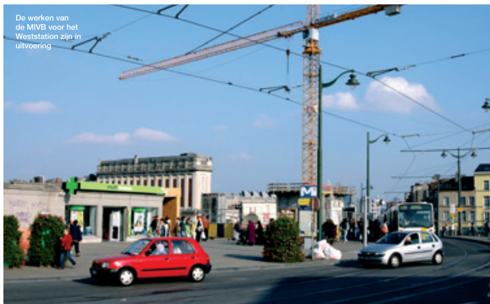
De werken van de MIVB voor het Weststation zijn in uitvoering

De wijken die aan weerszijden van het Weststation gelegen zijn, worden niet vergeten: er komt een nieuw Wijkcontract “Westoever” van 2008 tot 2011 , of het achtste dat door de Gemeente aangevraagd werd en ingevoerd wordt. En het is vooral de eerste keer dat er een