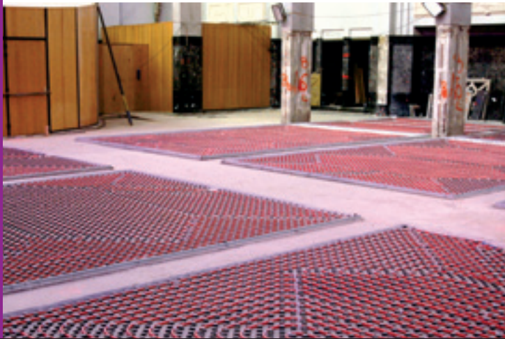
Un système de chauffage par le sol a été créé pour améliorer le chauffage de l'église Een systeem voor verwarming via de grond werd ingevoerd om de verwarming van de kerk te verbeteren