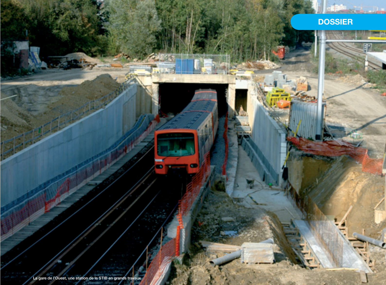
La gare de l'Ouest, une station de la STIB en grands travaux

prises et des habitants de la commune de Molenbeek-Saint-Jean. En plus, de nombreuses entreprises, surtout des marchands de charbon, s'étaient installées le long de la ligne de chemin de fer.