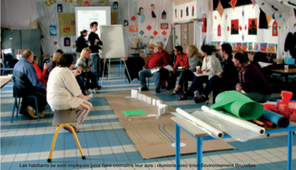
Les habitants se sont impliqués pour faire connaître leur avis : réunions avec Inter-Environnement Bruxelles