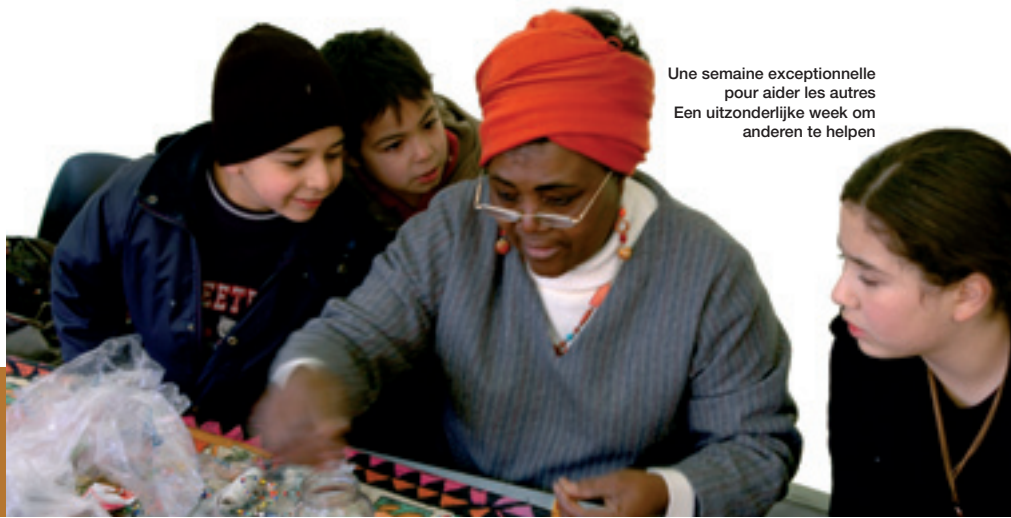
Une semaine exceptionnelle pour aider les autres Een uitzonderlijke week om anderen te helpen

Dankzij deze enkele dagen is men zich bewust kunnen worden van de verschillende aspecten van de solidariteitsverbintenis: Ik wist niet dat vissers uit Afrika door de mondialisering niet in hun levensonderhoud kunnen voorzien en ik wil ze daarom steunen , verklaart een Molenbeekenaar die aan een debat deelgenomen heeft. Het kwam er uiteindelijk op aan te kunnen nadenken over de gevaren die de planeet bedreigen en de manier om ze te bestrijden. In Molenbeek trachten we de mensen eerder dichterbij elkaar te brengen dan ze uiteen te drijven , besluit de Schepen. Een eerste geslaagde ervaring en een mooi menselijk avontuur.