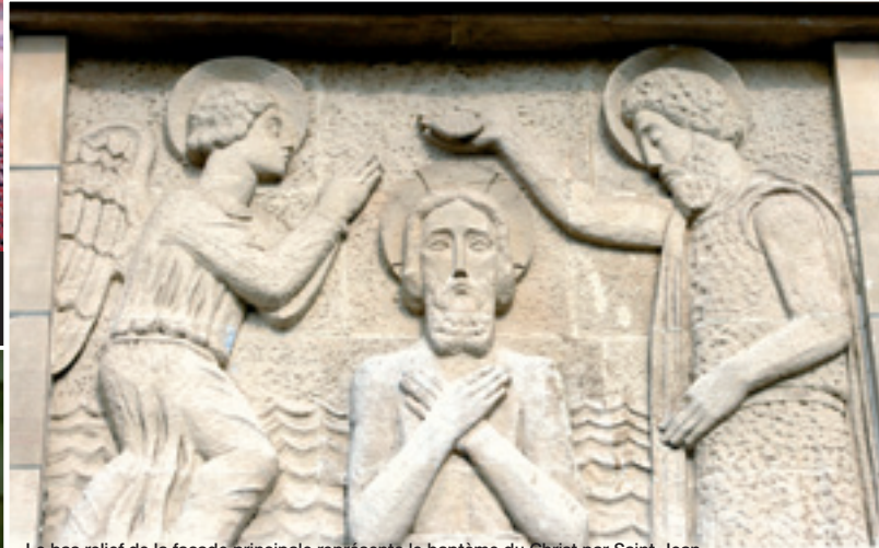
Le bas relief de la façade principale représente le baptême du Christ par Saint-Jean Het laagrelief van de hoofdgevel vertegenwoordigt het doopsel van Christus door Sint-Johannes.