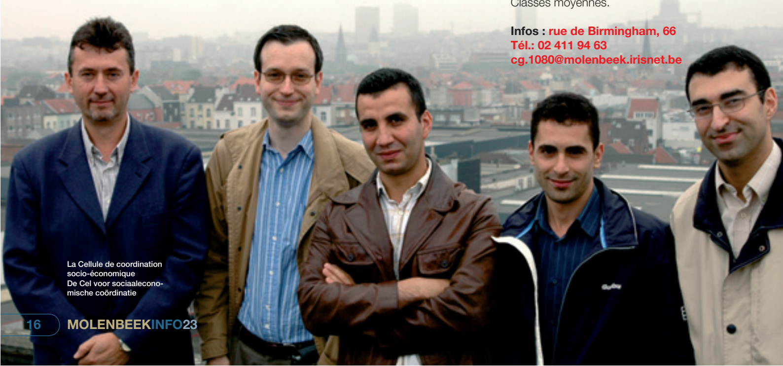
La Cellule de coordination socio-économique De Cel voor sociaaleconomische coördinatie

Infos : rue de Birmingham, 66 Tél.: 02 411 94 63 cg.1080@molenbeek.irisnet.be