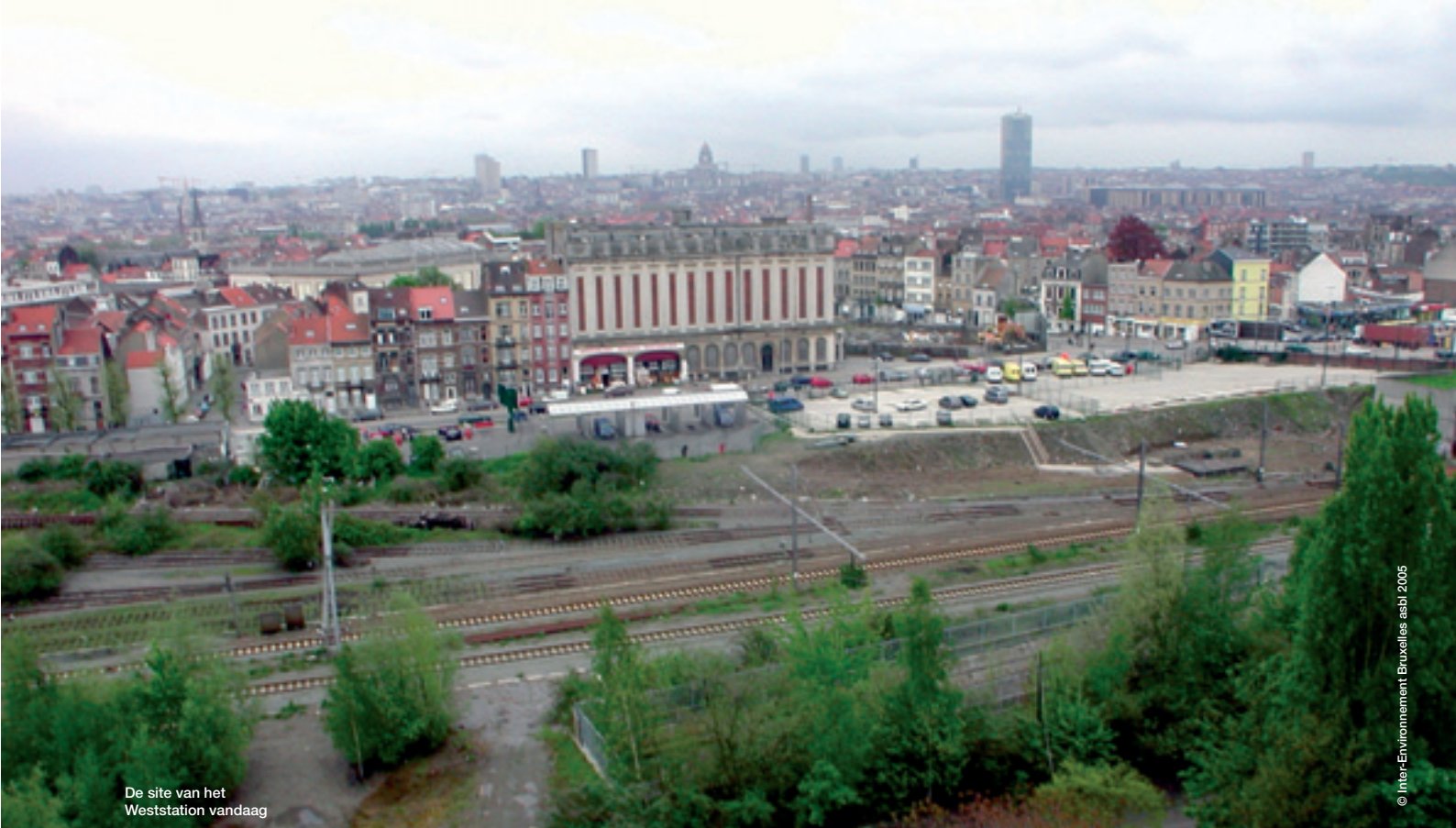
De site van het Weststation vandaag