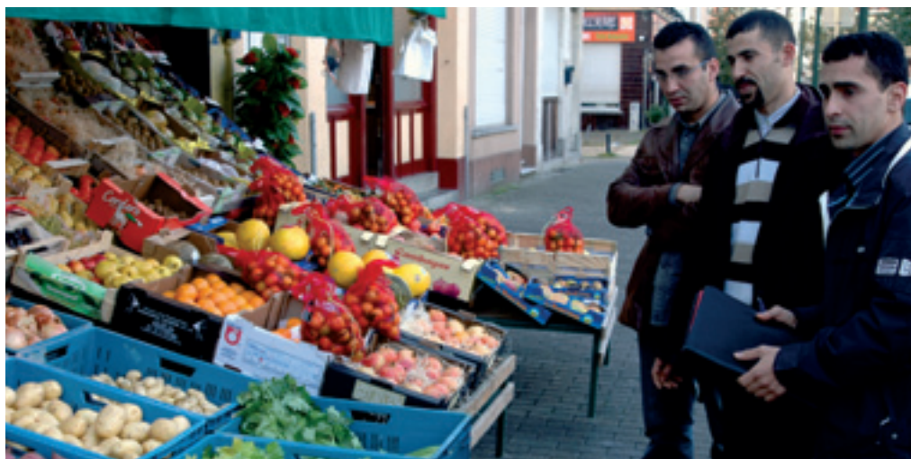
Contrôle des étalages des commerçants : un marchand en règle Controle van de etalages van de handelaars: een handelaar die de wet naleeft

De cel, die haar acties in de hoedanigheid van cel Garages voortzet, is vandaag de dag ook actief op sociaaleconomisch vlak aangezien het team op 3 specifieke vlakken opereert: Stedenbouw, Leefmilieu en de naleving van het APR (Algemeen Politiereglement). Hoewel de cel bevoegd is om bepaalde inrichtingen te sluiten, ge-