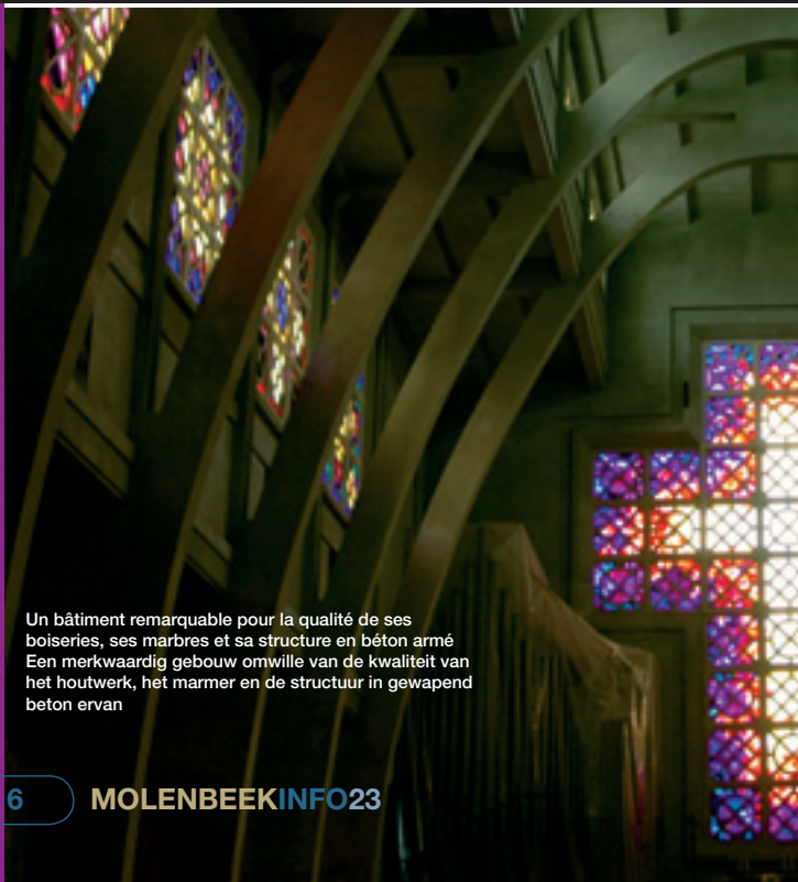
Un bâtiment remarquable pour la qualité de ses boiseries, ses marbres et sa structure en béton armé Een merkwaardig gebouw omwille van de kwaliteit van het houtwerk, het marmer en de structuur in gewapend beton ervan