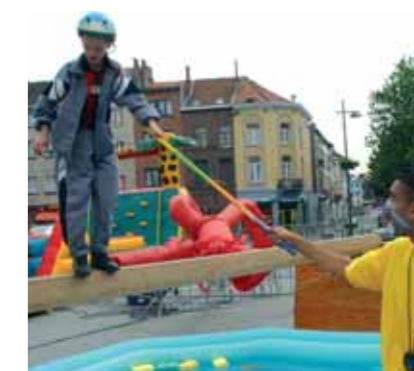
Animations sportives de la CLES

Au niveau du sentiment d'insécurité , des « ambassades de citoyenneté » seront créées dans chaque quartier en vue d'y développer la rencontre, pouvoir y exprimer les difficultés rencontrées et chercher une solution « citoyenne ». De plus, une nouvelle antenne de gardiens d'espaces publics sera implantée dans le quartier de la Duchesse de Brabant. Des éducateurs de rue seront engagés pour approcher et aider encore plus des jeunes en difficultés. Enfin, une