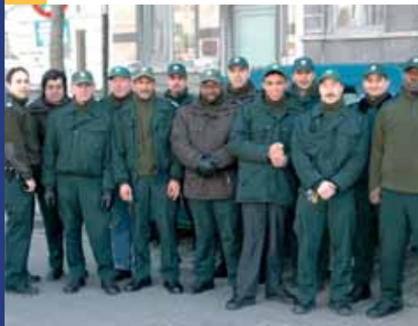
De parkwachters en de wachters van de openbare ruimte staan tot uw dienst

werd. Vervolgens worden alle oproepen die via het nr. 02/412.12.12 gevormd worden, beheerd door de zonedispatching, die zich in de Briedragerstraat bevindt. De radio-operatoren blijven aldus permanent in contact met de patrouilles op het terrein.