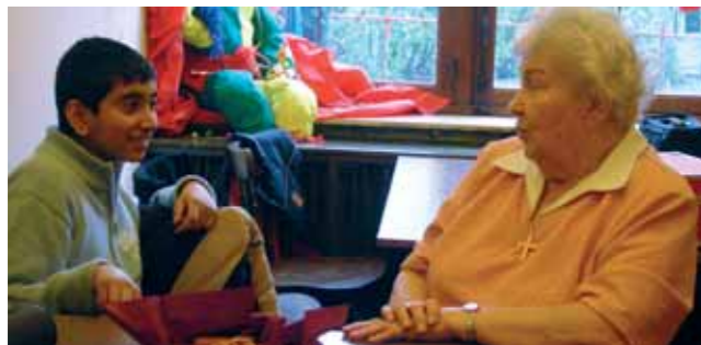
Des liens ont été noués entre les jeunes élèves et les seniors molenbeekoïses