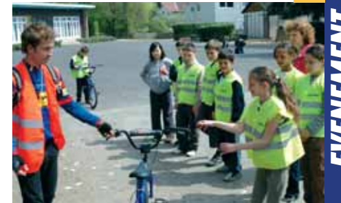
Apprendre à l'école à mieux maîtriser son vélo Op school zijn fiets beter leren beheersen