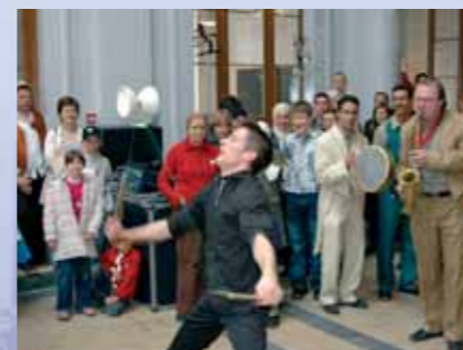
La nouvelle Maison des Cultures et de la Cohésion sociale Het nieuwe Huis van culturen en sociale samenhang

3. Het Maritiemhuis (Vandenboogaerdestraat 89. Tél.: 02/412.36.61) werd opgericht in het kader van wijkcontract Maritiem, in partnerschap met de BGDA en de GOMB. Het komt het uitgebreide programma inzake stadsvernieuwing aanvullen in de Maritiemwijk en draagt hierbij toe tot de sociale dynamiek ervan. Sociale, economische en culturele projecten worden er ontwikkeld. Elke partner bezit zijn eigen ruimte: in 2006 heeft de BGDA er zijn dienst «Job-