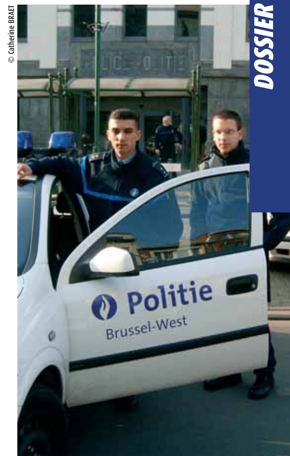
De interventiepatrouilles zijn voortaan sneller ter plaatse

De dienst, die uit 18 operationele en 2 administratieve politiemensen samengesteld is, behandelt eveneens het bezoekrecht, het