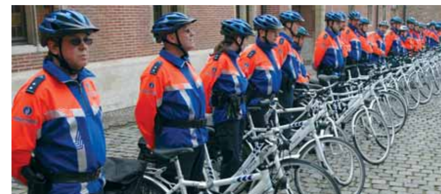
En avril 2006, une « Brigade cycliste de surveillance » a été créée

Dans le plan zonal de sécurité 2005-2008, les vols dans les véhicules et les sac-jackings constituent une priorité. Pour les premiers, les résultats évoluent positivement si l'on compare les chiffres de ces 4 dernières années. 2002 : 677 faits, 2003 : 510, 2004 : 305 et 2005 : 376 ; soit une diminution de 48,2 % des vols enregistrés. Pour les sac-jackings, la diminution est encore plus sensible depuis 2002 puisqu'elle est de 54,6 %.