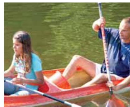
De politiemannen en de jongeren treffen elkaar ook in Cornimont (Ardennen)