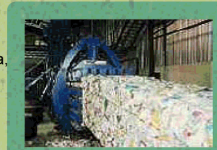
PMD PERSEN IN BALEN

GEEN: yoghurtpotjes, margarinevlotjes, plastic bekertjes, plastic zakjes, piepschuim, aluminiumfolie, bloempotjes