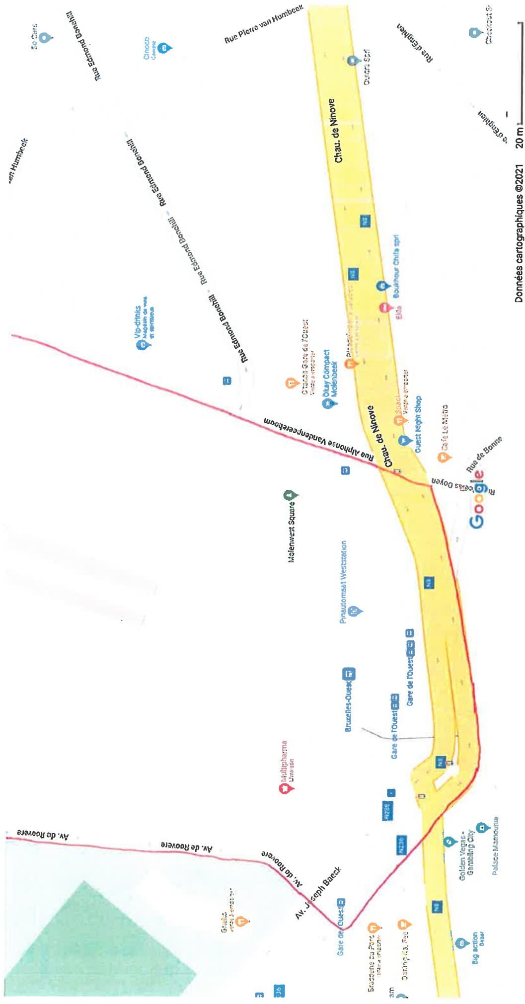
Données cartographiques ©2021