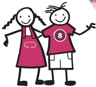
PLACE VAN HOEGAARDE VAN HOEGAARDEPLEIN