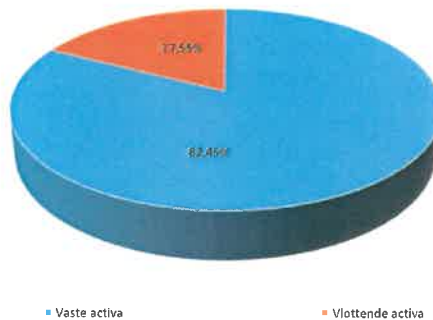
STRUCTUUR VAN DE ACTIVA