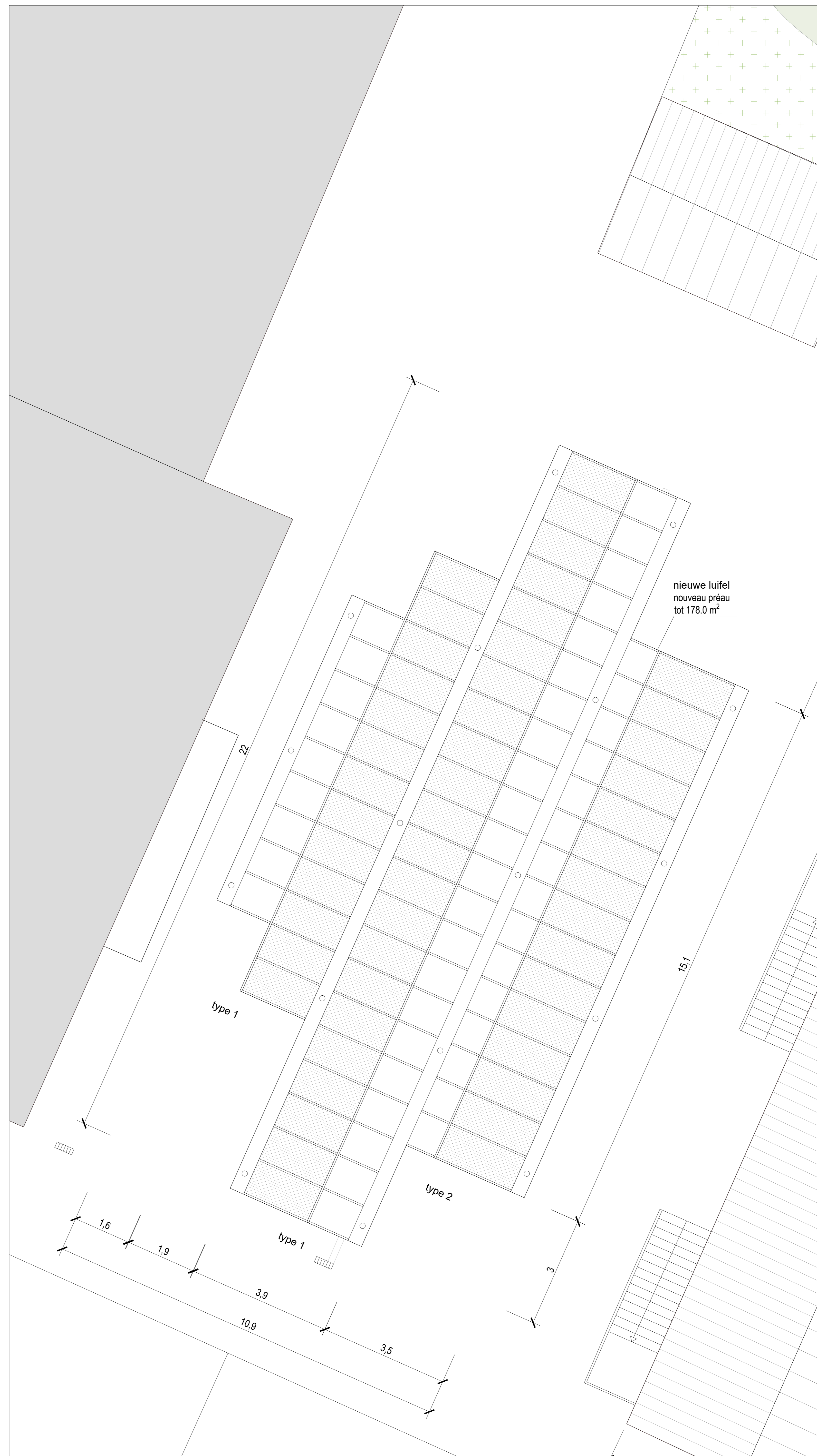
GEWENST: DAKENPLAN / PROJET : PLAN DE TOITURE 1 | 50