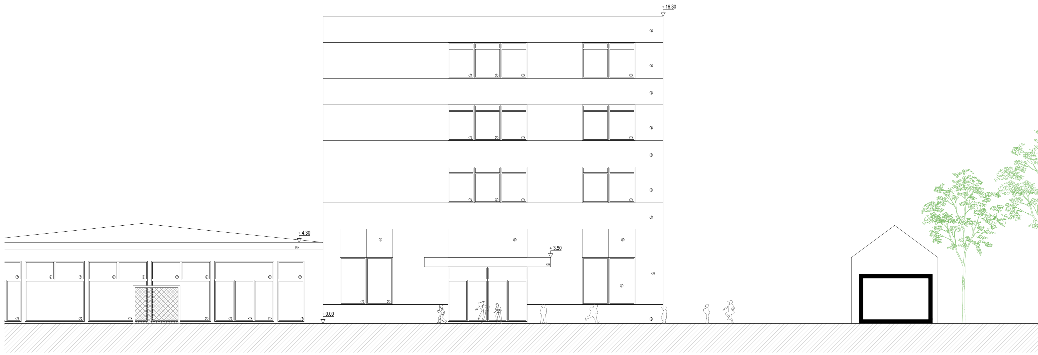
BESTAAND: SNEDE BB / EXISTANT : COUPE BB 1 | 100