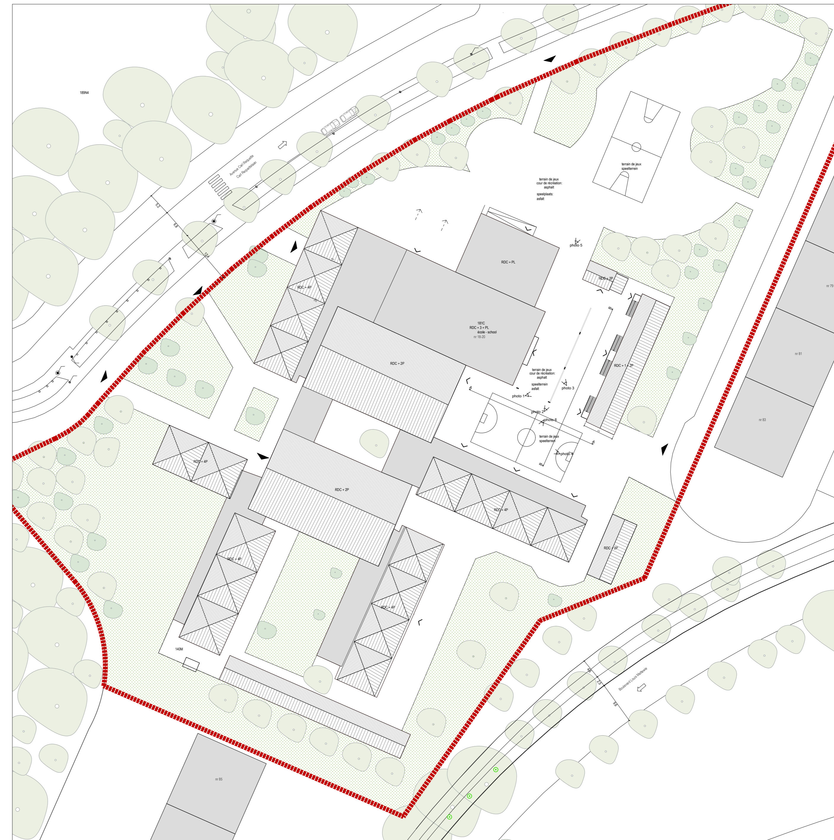
BESTAAND : INPLANTINGSPLAN / EXISTANT : PLAN D'IMPLANTATION 1 | 500