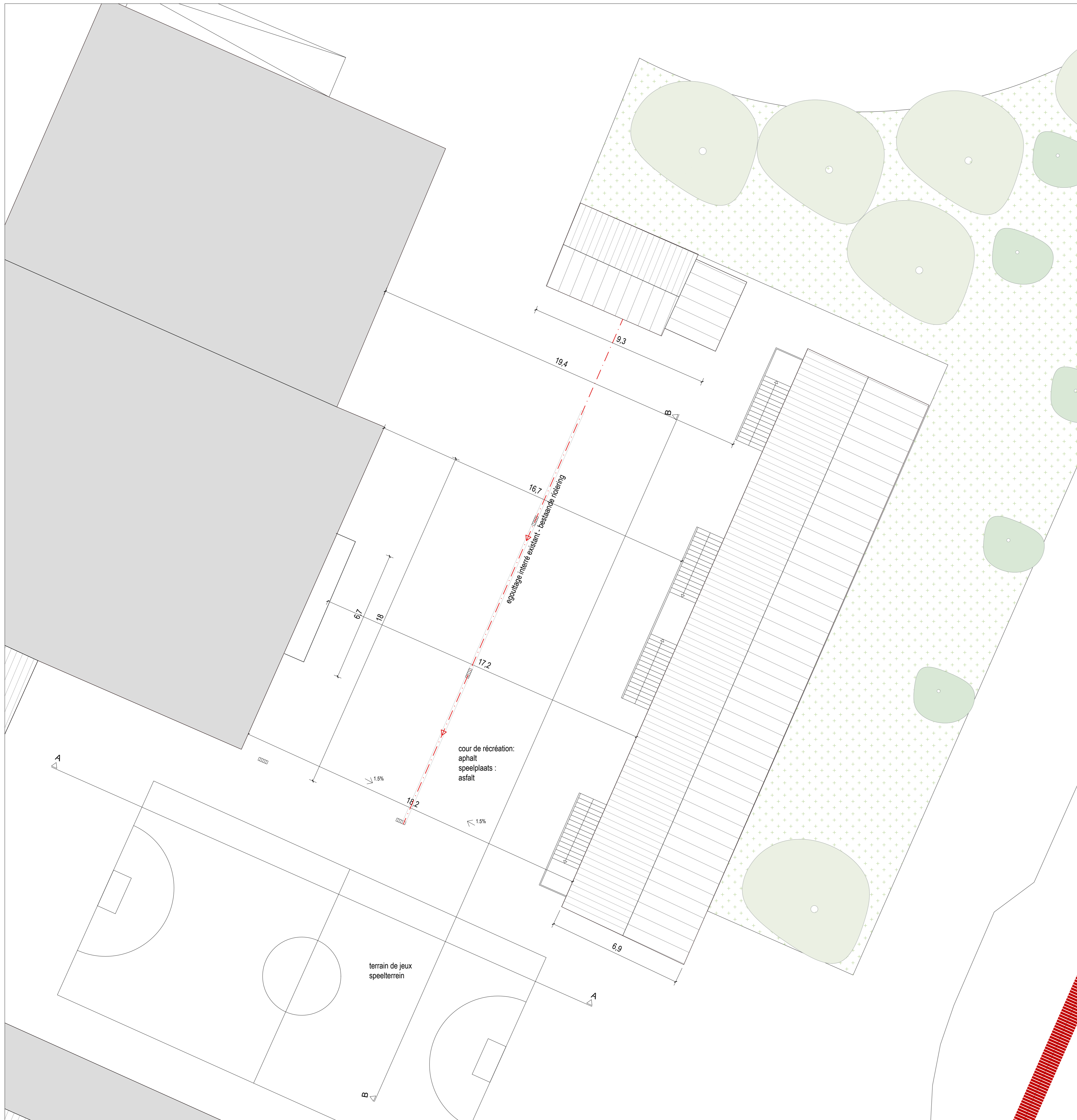
BESTAAND: GRONDPLAN / EXISTANT : PLAN RDC 1 | 100