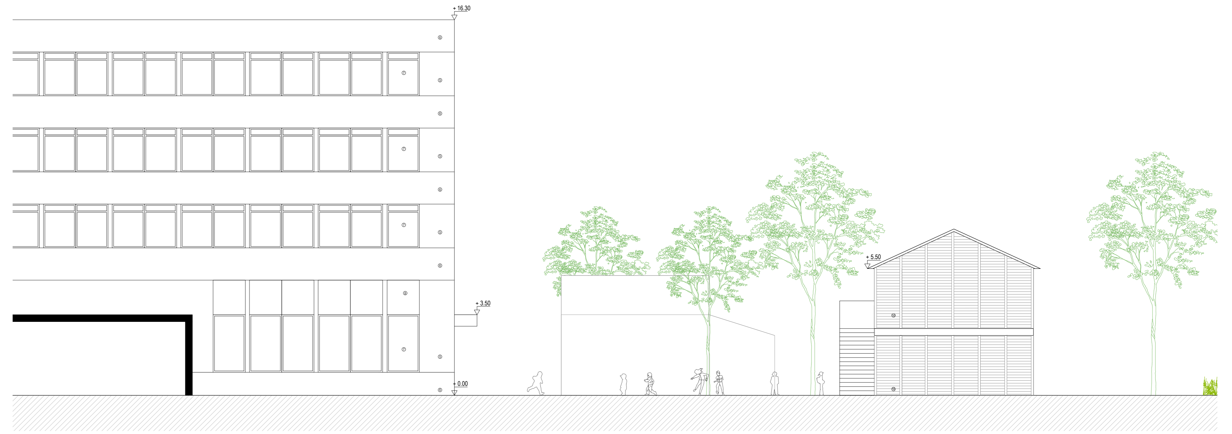
BESTAAND: SNEDE AA / EXISTANT : COUPE AA 1 | 100