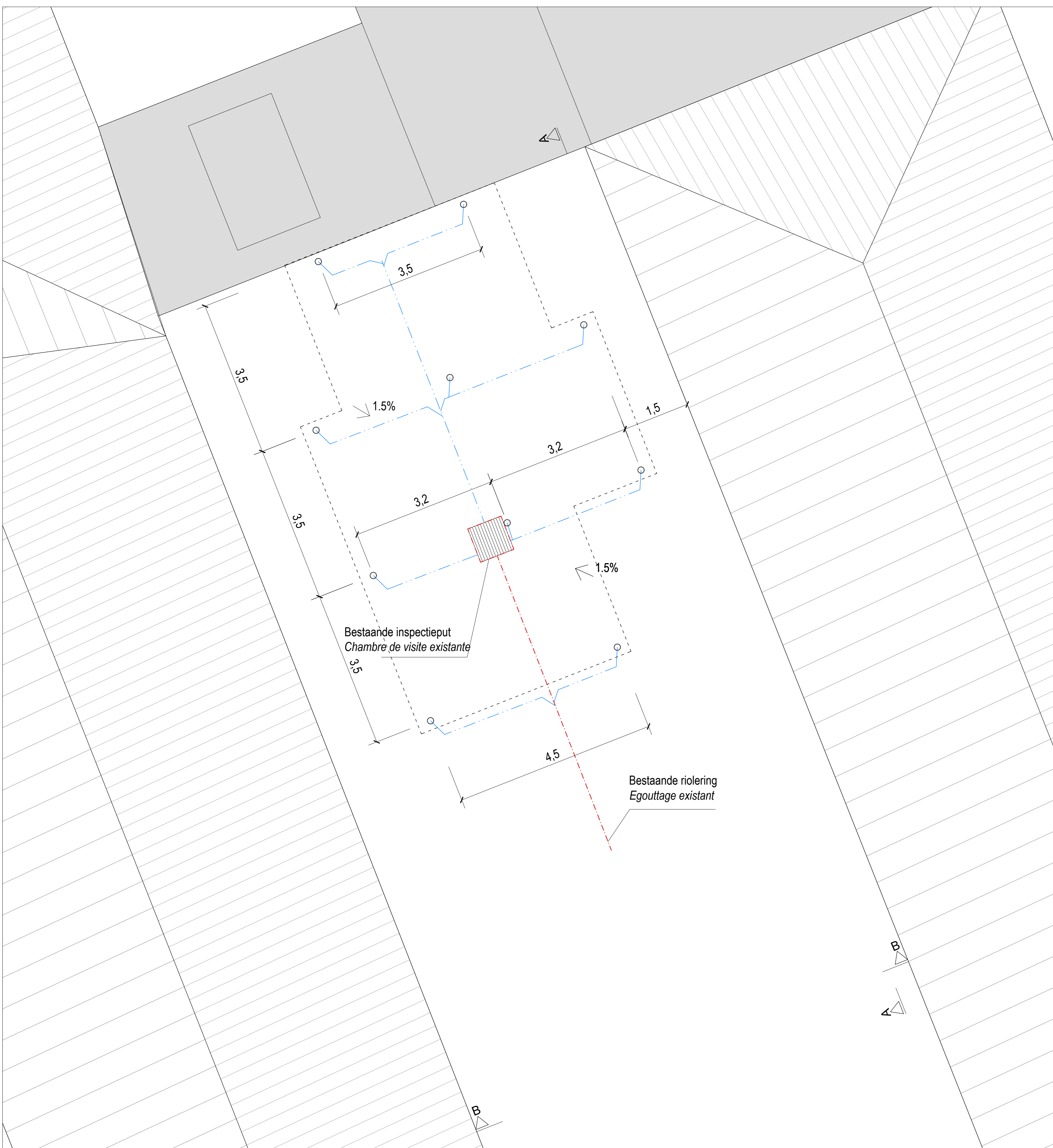
GEWENST: GRONDPLAN / PROJET : PLAN RDC 1 | 50