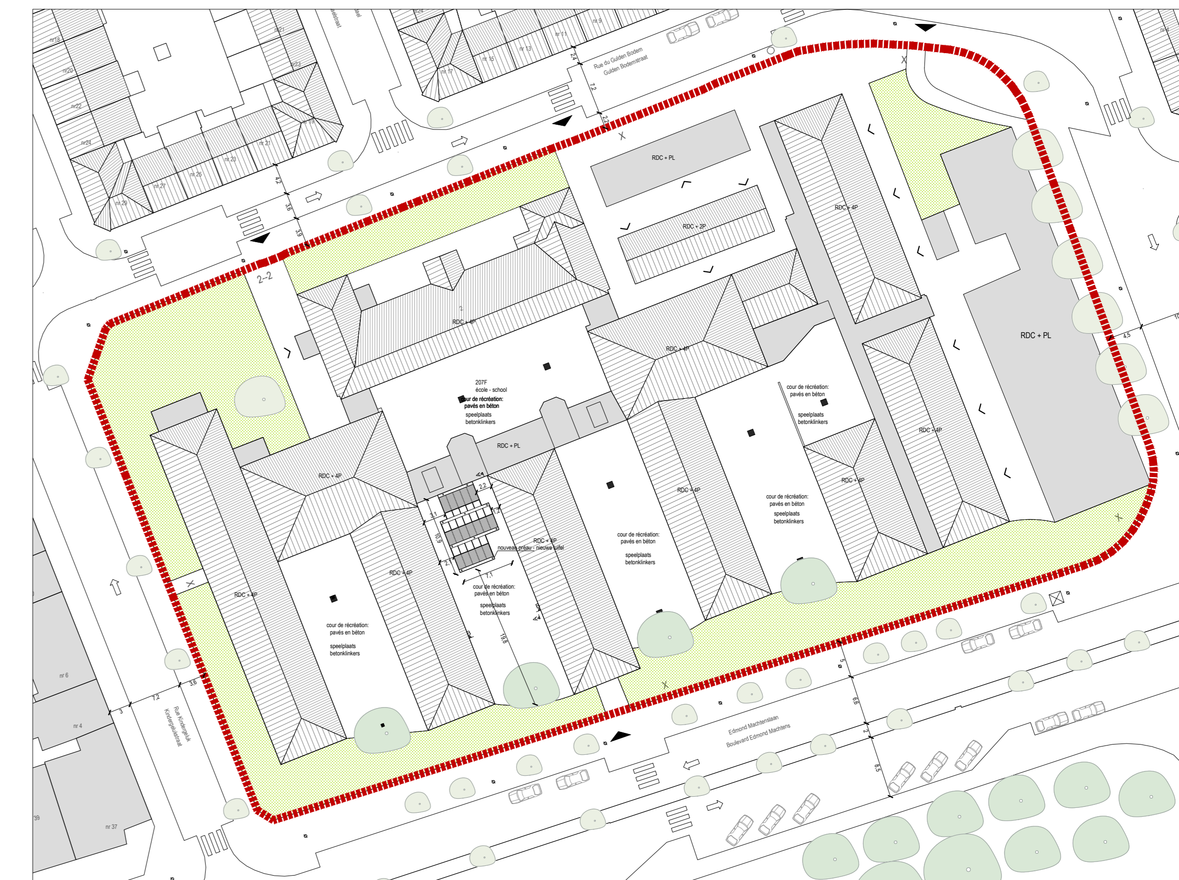
GEWENST: INPLANTINGSPLAN / PROJET : PLAN D'IMPLANTATION 1 | 500