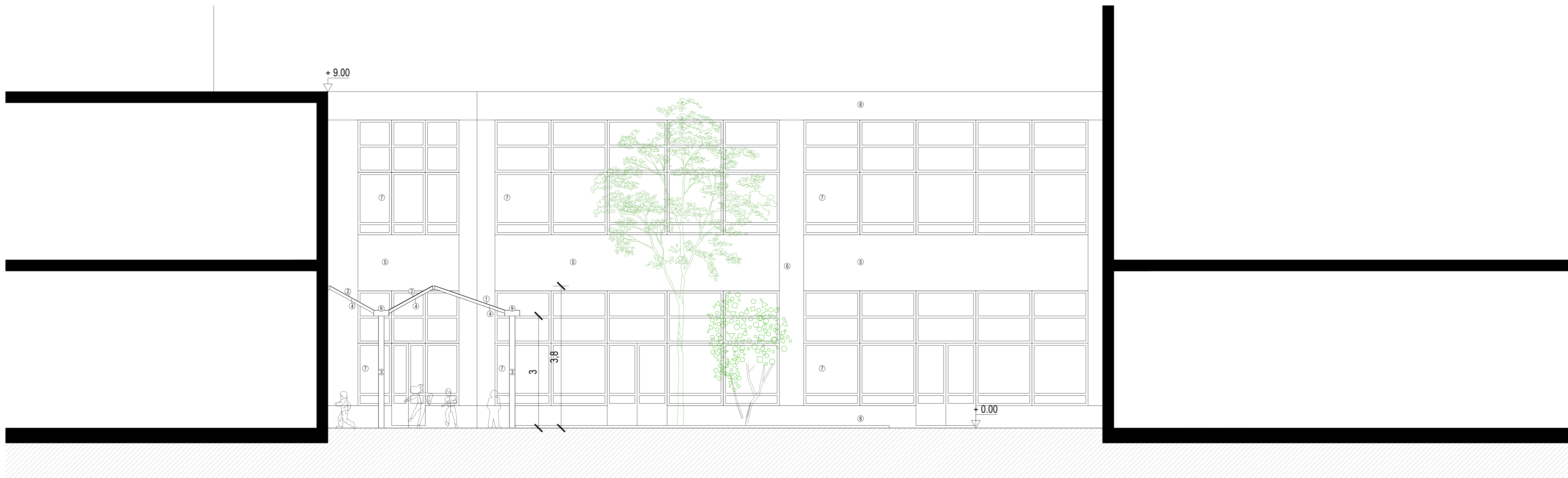
GEWENST: SNEDE AA / PROJET : COUPE AA 1 | 50