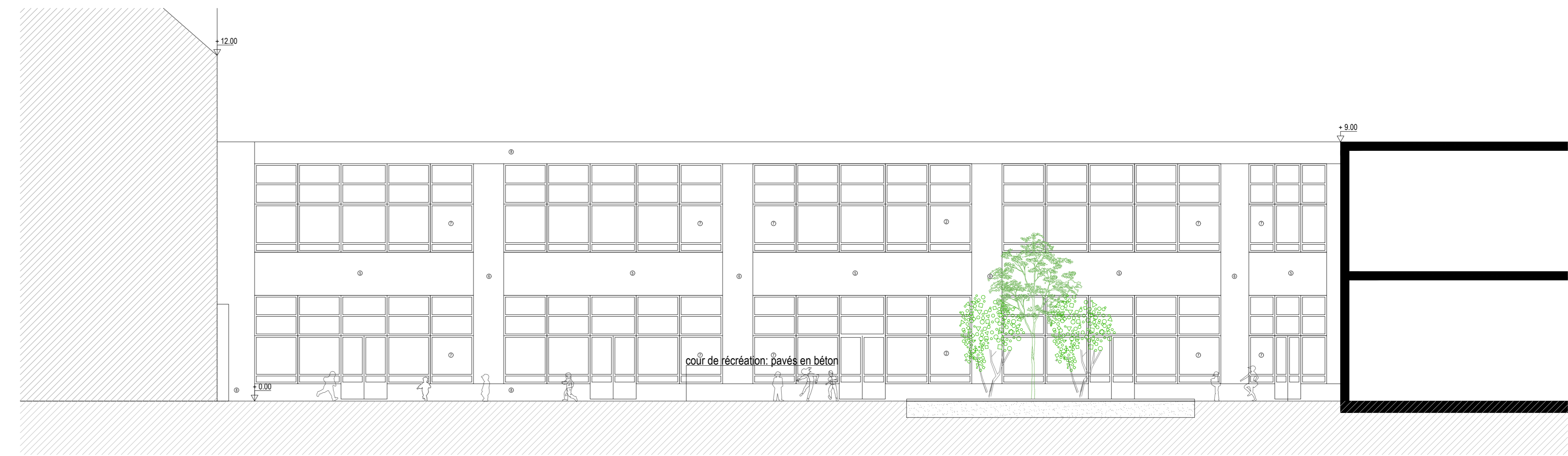
BESTAAND: SNEDE BB / EXISTANT : COUPE BB 1 | 100