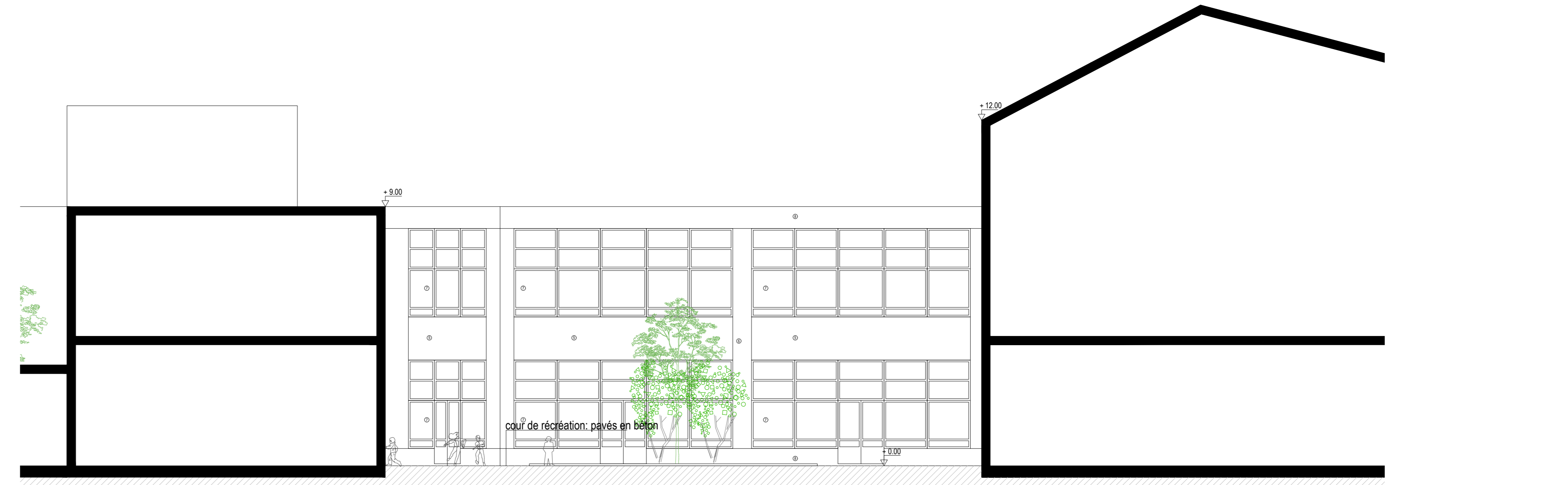
BESTAAND: SNEDE AA / EXISTANT : COUPE AA 1 | 100